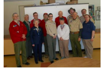
Reunion Anual 2014

Nuestra reunión anual de 2014 tuvo lugar durante un lindo fin de semana del 4 al 6 de abril, en el campus de la escuela de Amigos "Sandy Spring Friends," en Sandy Spring, Maryland, con 14 miembros asistentes. Nos "acampamos," y tuvimos nuestras sesiones de negocios y trabajo en un par de salas y el gimnasio; gozamos de las comidas en el comedor de la escuela; armamos un par de exhibiciones en la biblioteca; hicimos una gira del campus; y la mañana del domingo adoramos con los miembros de la junta de Amigos, "Sandy Spring Friends."