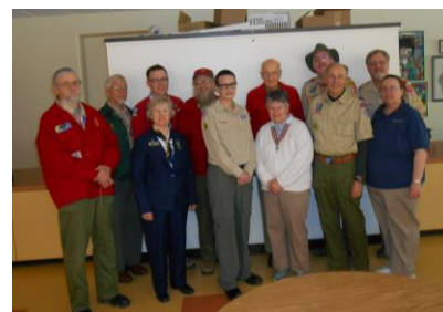
FCS Annual Meeting 2014

Our 2014 Annual Meeting was held on a beautiful spring weekend, April 4 th – 6 th , on the campus of Sandy Spring Friends School, in Sandy Spring, Maryland, with 14 members present. We ‘camped out’ and held our business and work sessions in a couple of ‘all purpose’ rooms in the gym, enjoyed meals in the school cafeteria, had a couple of displays set up in the library, toured the campus and worshiped with members of Sandy Spring Friends Meeting on Sunday morning.